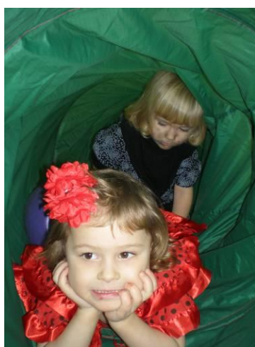
Karneval v DDM