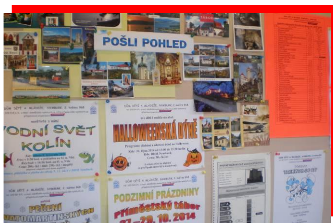
Propagační činnost – venkovní vitrína DDM Nymburk

Celkovou nabídku zájmové činnosti pro školní rok 2013/2014 a jednotlivé aktivity jsme propagovali prostřednictvím vlastních letáků, které zveřejňujeme na svých webových stránkách a rozesíláme je do škol a do zařízení pracujících s dětmi a mládeží jak ve městě, tak v jeho okolí. Ve spolupráci s Městským kulturním střediskem využíváme plakátovacích ploch města. Informace zveřejňujeme v Městském zpravodaji, který vydává Městský úřad Nymburk jako měsíčník. V rámci komunitního plánování města Nymburk zveřejňujeme své akce na webových stránkách Elektronického informačního systému sociálních služeb. Při zveřejňování informací o našich akcích dále spolupracujeme s následujícími institucemi: Městská knihovna, Informační centrum města Nymburk, občanské sdružení Semiramis, mateřské centrum Svítání, mateřské školy a základní školy ve městě a v okolních obcích.