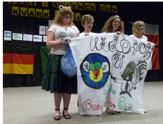
Kvark 2014 – finále soutěže Klubu malých debružárů