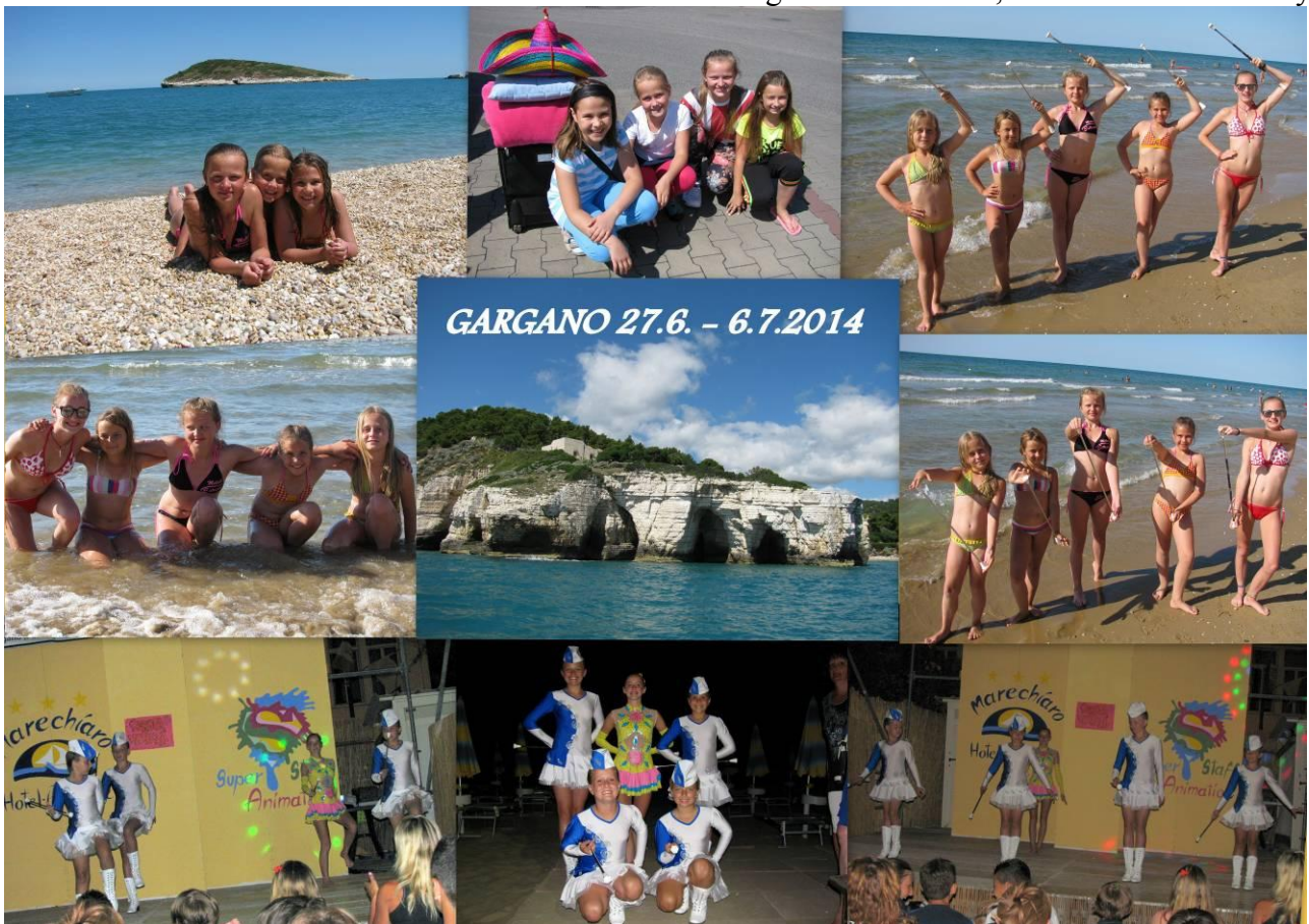
Činnost zájmového útvaru Mažoretky