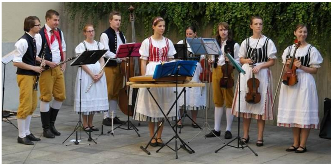
Činnost zájmového útvaru Šáteček