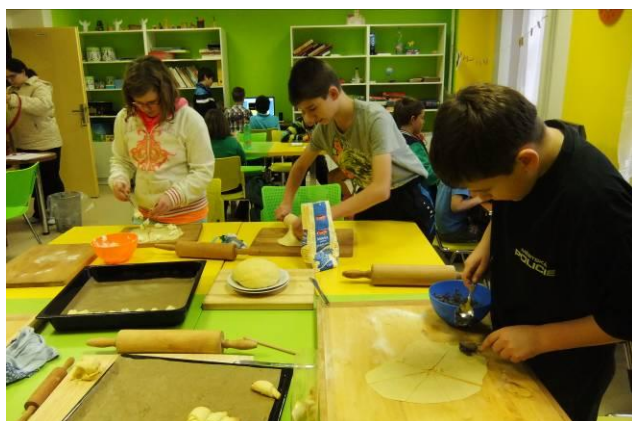
Svatomartinské pečení rohlíčků