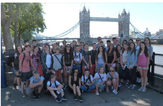
Poznávací zájezd Klubu malých debrujářů do Anglie