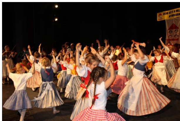
Vystoupení Šátečku na Akademii DDM Nymburk