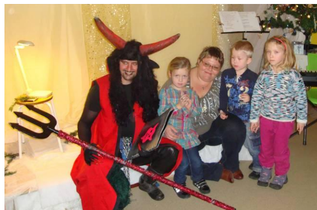
Mikuláš v DDM