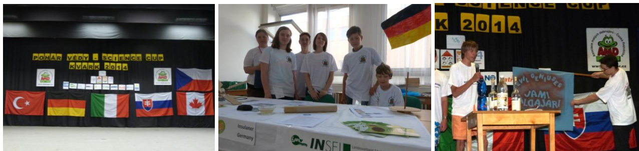
Mezinárodní soutěž Pohár vědy – Kvark 2014