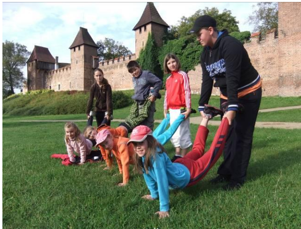
Příměstský tábor 25.-29.8.2014