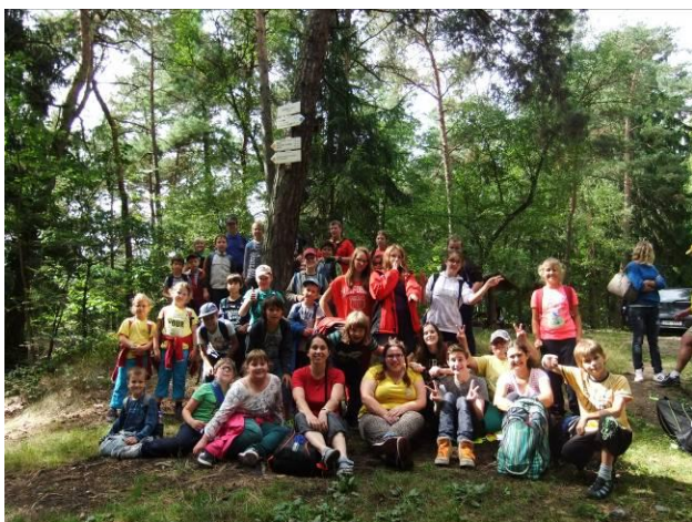
Příměstský tábor 18.-22.8.2014