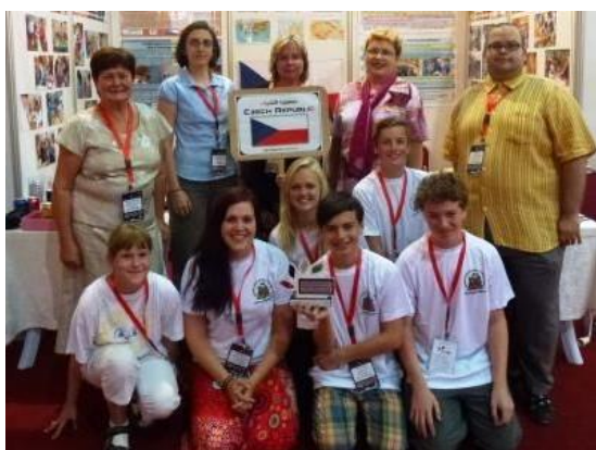
Český stánek na Expo Science Asia Jordánsko