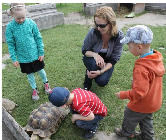
ZOO Chleby – výlet