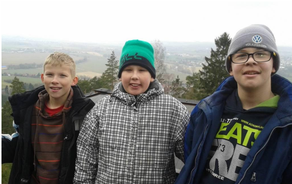
Příměstský tábor – jarní prázdniny 24. - 28. 2. 2014