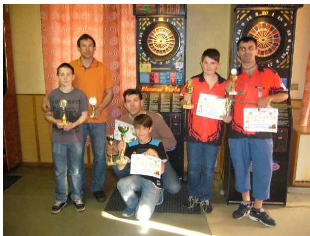
Velikonoční turnaj dvojic – elektronické šipky