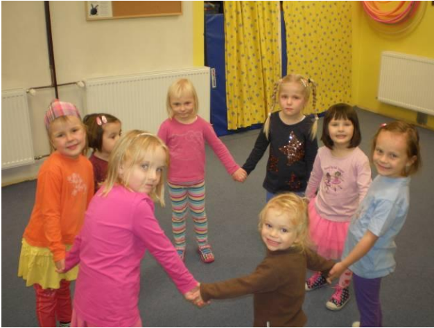
Cvičení při hudbě