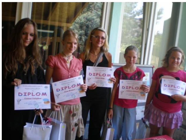
Soutěž Malování U Kotherů