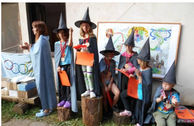
Letní tábor Mukařov