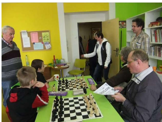
Šachový turnaj seniorů a jejich vnuků